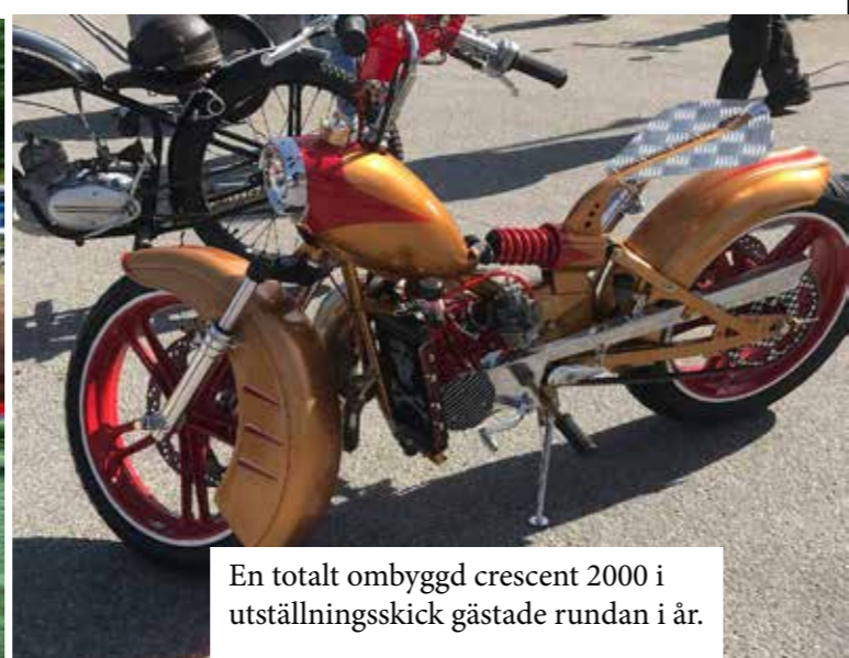
En totalt ombyggd crescent 2000 i utställningsskick gästade rundan i år.