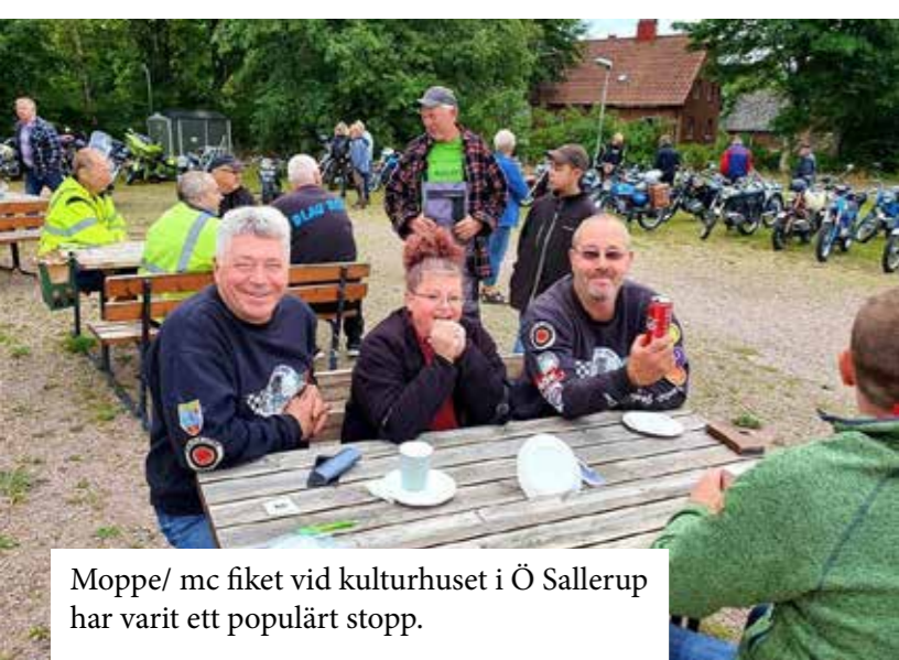
Moppe/ mc fiket vid kulturhuset i Ö Sallerup har varit ett populärt stopp.