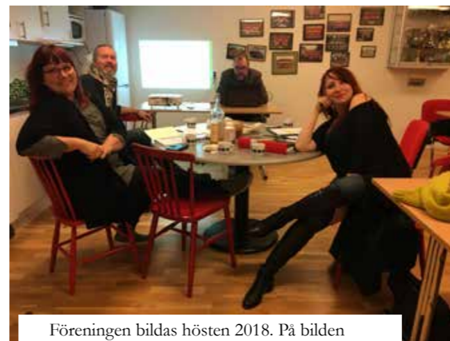
Föreningen bildas hösten 2018. På bilden några av gänget som varit med från starten.