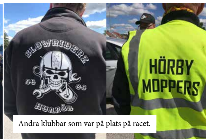
Andra klubbar som var på plats på racet.