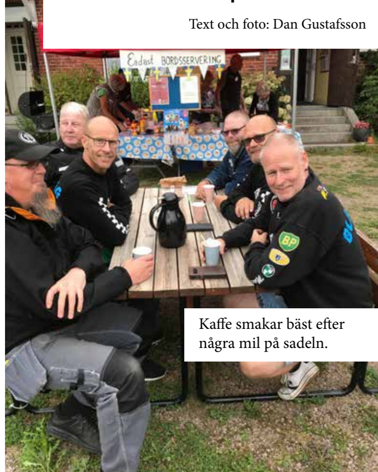
Kaffe smakar bäst efter några mil på sadeln.