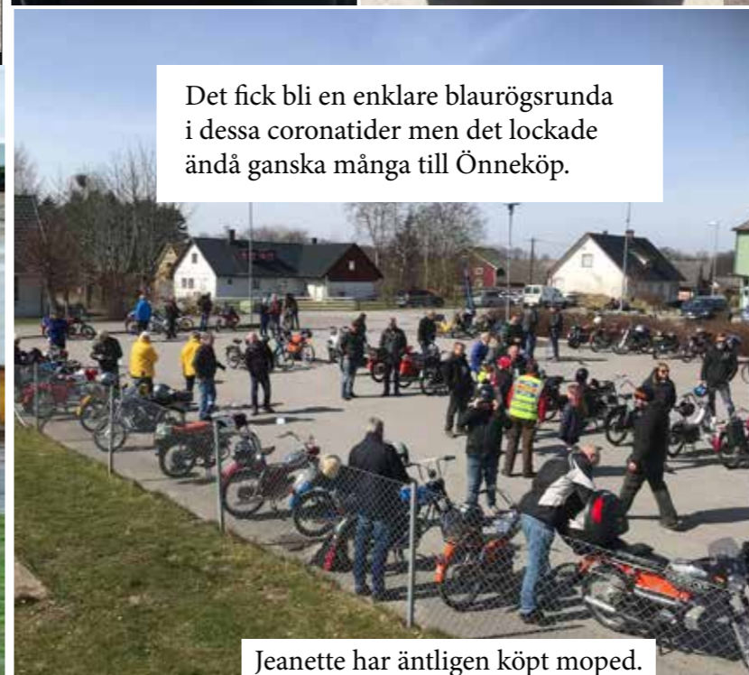
Det fick bli en enklare blaurögsrunda i dessa coronatider men det lockade ändå ganska många till Önnköping.