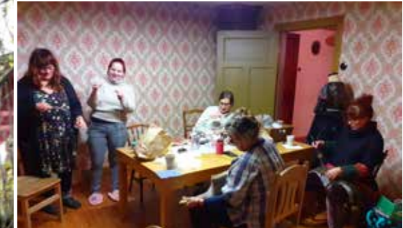
Syjuntan en regnig torsdagskväll i byn: Att hantverka tillsammans är både roligt och avkopplande. Men att spinna är inte så lätt i början!