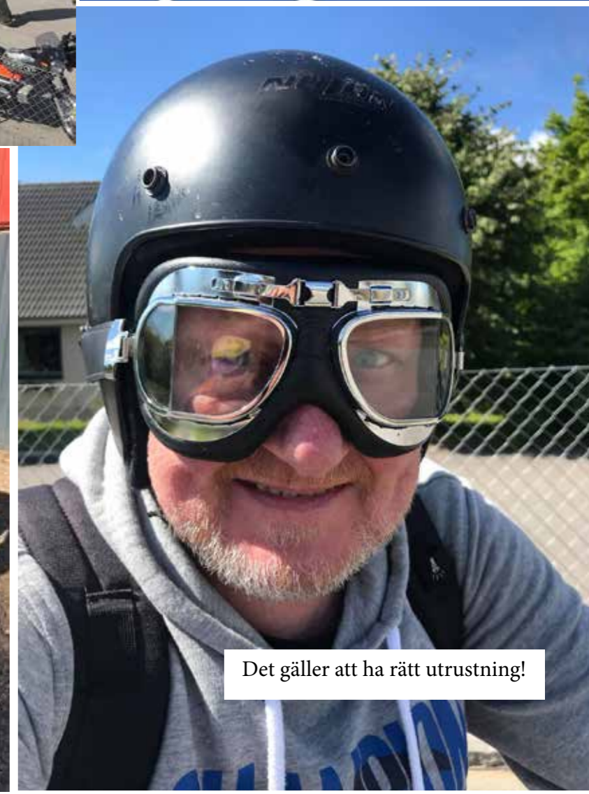
Det gäller att ha rätt utrustning!