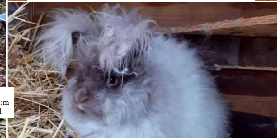
Ceasar är en skånsk angora i färgen Havanna.