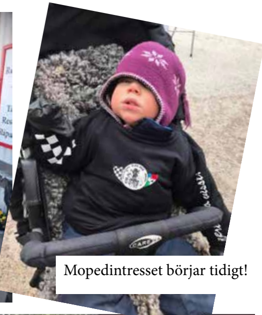
Mopedintresset börjar tidigt!