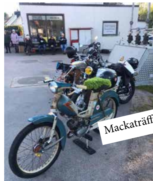
Mackträffen i vollsjö!

Torget i Önnköping fungerar som samlingsplats innan vi gemensamt kör till målet för dagen t ex mackträffen i Vollsjö eller moped- och mccaféet i Östra Sallerup.